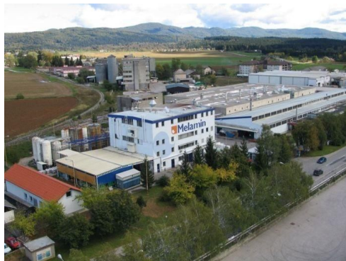
Proizvodni obrat podjetja Melamin (Melamin., 2017)

Obenem so razvili tudi novost v svetovnem merilu, melaminski biopolimer iz obnovljivih virov surovin, v njihovem primeru iz lesne biomase. Uporabljal se bo na področju premazov kot zamreževalec v pečno sušičih aplikacijah in bo lahko nadomestil obstoječi proizvod fosilnega izvora. Projekt zajema poleg razvoja izdelka tudi razvoj novih postopkov in tehnologij za industrijsko proizvodnjo, financiran pa je tudi s strani Ministrstva za gospodarski razvoj in tehnologijo RS ter Evropskega sklada za regionalni razvoj.