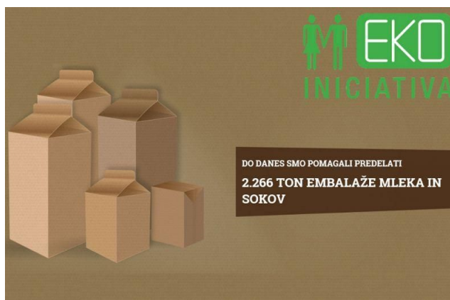
Eden od dosežkov Eko-iniciative

Z visokokakovostnim recikliranjem so razvili več vrst novih uporabnih izdelkov, s tem pa dosegli stabilnost cen zaradi neodvisnosti od trga celuloze, samooskrbo lokalne skupnosti z izdelki za objektno higieno. Zaprt krog izdelave in reciklaže omogoča spremljanje vplivov proizvoda na okolje skozi njegov celotni življenjski cikel, s tem pa so dosegli prepoznavnost in dvignili zavest o krožni kulturi v lokalni skupnosti. Za izjemne dosežke na področju krožnega gospodarstva je Valtex prejel tudi priznanje »highly recommended« s strani globalnega natečaja The Circulars, ki ga vsako leto podeljuje Svetovni gospodarski forum.