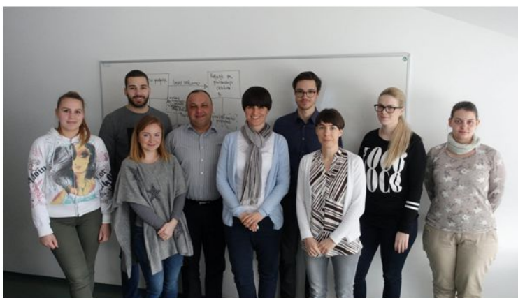
Ekipo e-Simbioze (e-Simbioza, 2017)

Portal E-Simbioza je slovensko spletno tržišče za različne materiale, ki poskuša uveljaviti koncept industrijske simbioze – bolj učinkovite rabe materialov skozi iskanje sinergij med potrebami različnih podjetij. Prosto dostopno spletno orodje služi za vpogled v ponudbo in povpraševanje, navezavo stikov z deležniki in izmenjavo informacij pred začetkom sodelovanja. Na njej je mogoče tako oddati povpraševanje po določenem materialu in količini, kot tudi nuditi presežne ali odpadne materiale. Algoritem poveže povpraševanje in ponudbo, kupca in prodajalca, ki nato sama skleneta posel. Razvila jo je ekipa raziskovalcev, visokošolskih učiteljev in študentov Fakultete za informacijske študije v Novem mestu ter delovnih mentorjev partnerskih institucij – Komunale Novo Mesto d.o.o. in Društva za razvijanje prostovoljnega dela Novo Mesto.